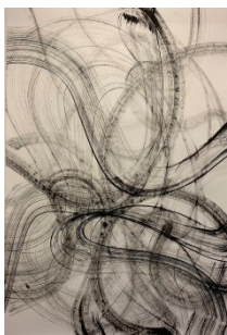
Rob Bouwman Tekeningen en schilderijen

Het zijn vaak kunstenaars die dit onderzoek verbeelden. Zij gaan spelenderwijs op avontuur en nemen ons mee in hun zoektocht.