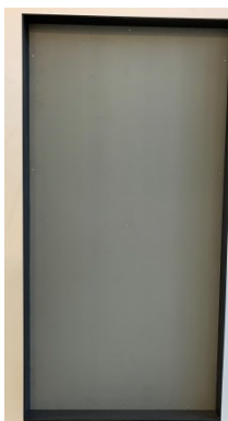
Jochem van Grieken Robotica

'Gekko' is een robot die schijnbaar doelloos in een kader aan de muur 'rondloopt'. Wat doet die robot daar, en waarom?