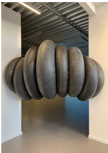
Corine Zomer Installatie met banden

Corine Zomer speelt met de relatie tussen ruimte en object. Door enorme rubber banden te plaatsen op ongebruikelijke plekken daagt zij de bezoeker uit om in te gaan op deze relatie.